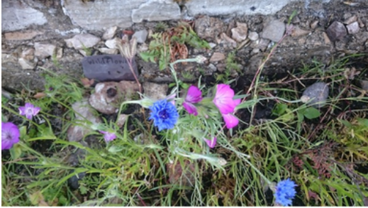
Cuirfidh Artlink 'Signs of Biodiversity' i láthair ag Artlink, An Dún Riabhach, Bun Cranncha, ar Oíche Chultúir.

Beidh Oíche Chultúir, an ócáid phoiblí bhliantúil uile-oileáin a cheiliúránn cultúr, cruthaitheacht agus na healaíona, ar siúl Dé hAoine, 18 Meán Fómhair. Mar fhreagairt ar na srianta a bhaineann leis an phaindéim leanúnach, cuirfear clár na bliana seo i láthair in imeachtaí beo agus ar líne araon agus beidh deis ag daoine abhus agus thar lear ceangal a dhéanamh le cultúr Dhún na nGall.