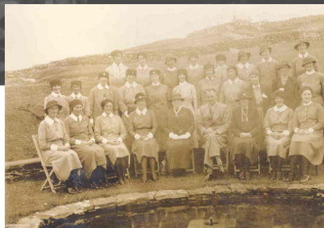
Coiste Chlub Sláinte Fhánada, c1931, a pléadh sa chur i láthair Facebook 21 Bliain 21 Seoda Cartlainne. Le caoinchead ó Chartlann Chontae Dhún na nGall

An tArd-Ghiúiré deireanach i nDún na nGall 1899. Le caoinchead ó Chartlann Chontae Dhún na nGall