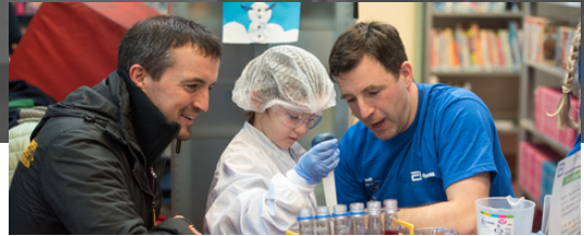
Seachtain Eolaíochta i Leabharlann Bhun Dobhráin.