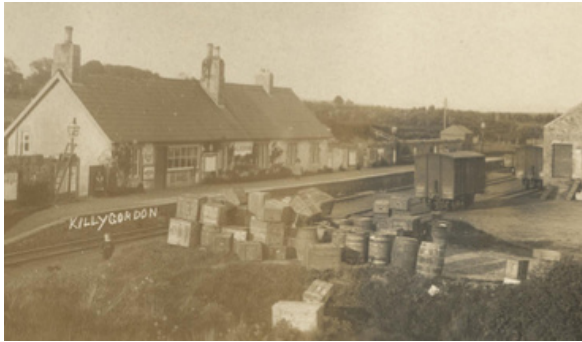
Stáisiún Iarnróid Chúil na gCuirridín.

Athosclaíodh an Músaem Dé Céadaoin 26 Lúnasa. D'oibrigh muid go cruá chun athoscailt shábháilte thaitneamhach a chinntiú do chuariteoirí agus eile, agus táimid réidh agus ag fanacht le fáilte a chur romhat ar ais chun taitneamh a bhaint as ár réimse iontach taispeántas. Ina measc seo tá ár dtaispeántas úr - Iarnróid Chontae Dhún na nGall ag taispeáint íomhánna ó A. M. Davies' ó Bhailiúchán Chartlann an Chontae, a insíonn scéal brónach faoi laethanta deiridh na n-iarnród i nDún na nGall.