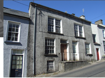
'House on the Brae', Ráth Mealtain.