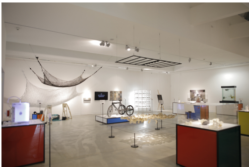
Taispeántas PLAISTEACH san Ionad Cultúrtha Réigiúnach

Tá an taispeántas seo saor in aisce agus oiriúnach don teaghlach ar fad ach is gá áirithint a dhéanamh. Chun do thuras teoraithe a chur in áirithe tabhair cuairt anseo nó glaoigh ar (074) 912 9186